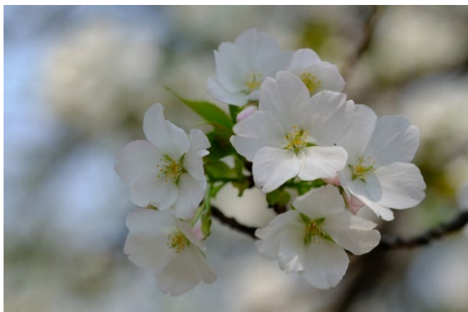
■春（撮影：千葉光雄、団員 2025/3/26）