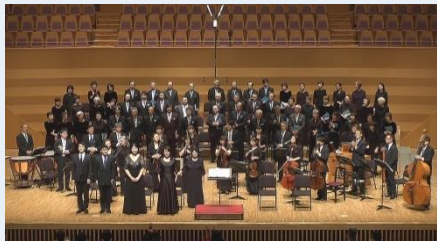
▲《ロ短調ミサ曲》日本語上演(2017年11月23日、杉並公会堂)

東京芸術大学楽理科、つづいて作曲科卒業後、ストラズブル大学と音楽院に留学、1962年帰国とともに合唱団設立、2012年に創立50周年を迎えた。バッハ宗教合唱作品のほぼ全曲の上演用訳詞を完成、多くは自らの指揮で上演し、バッハ音楽普及に貢献している。「バッハ コラール・ハンドブック」(春秋社刊)ほか著書訳書多数。現在日本語版バッハ・カンタータ楽譜集刊行中(既刊77曲)。